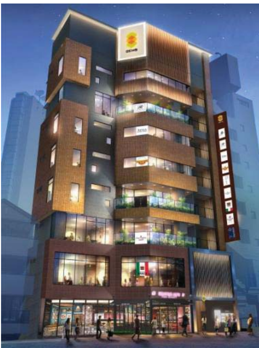
≪『GEMS 恵比寿』外観イメージパース≫

恵比寿はかつて街一体にビール工場があったエリアであり、ビール工場跡地の再開発事業(恵比寿ガーデンプレイス)を契機に大きな変貌を遂げた街です。現在では近接する広尾、白金台等とともにおしゃれな街として認識されるだけでなく、住みたい街ランキングの上位に選ばれる等、ショッピングや飲食、娯楽施設をはじめ、オフィス、住居までそろった充実の街として評価を得ております。さらに、近年恵比寿駅西口に商業施設がオープンし、駅東西の回遊性が向上した事により、今後は恵比寿駅の更なる発展が期待されます。『GEMS 恵比寿』は、恵比寿の食文化をけん引する新たな美食空間となるべく、街づくりの一環としてこの街を更に輝かせる都市型商業施設を目指してまいります。