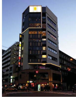
『GEMS 市ヶ谷』 2014年11月開業