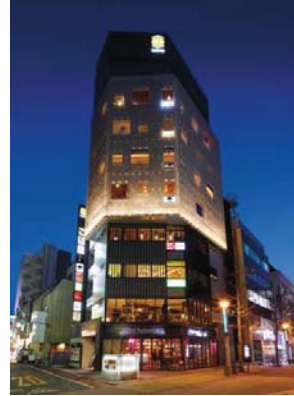
『GEMS 大門』 2016年3月開業