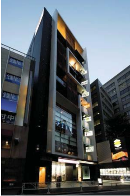
『GEMS 渋谷』 2012年10月開業

野村不動産グループでは、「野村不動産グループ 中長期経営計画（-2025.3）～Creating Value through Change～」において、商業施設事業の拡大を成長戦略の一つに掲げております。2018年以降、9棟の「GEMS」シリーズのオープンを予定しており、今後年間6物件ずつの用地取得を行い、「GEMS」シリーズの開発を積極的に行ってまいります。